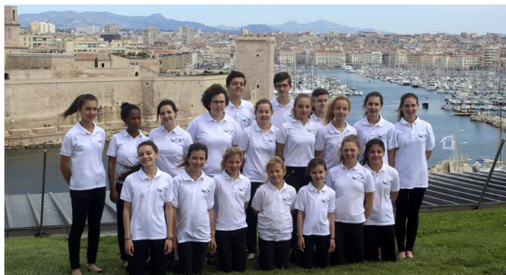
Le chœur d'enfants de Marseille de passage à Colmar, jeudi.

La manécanterie des Petits Chanteurs de la Major, chœur d'enfants de Marseille, accueillie par la manécanterie de filles de Saint-Jean de Colmar, sera en concert, jeudi, à la collégiale Saint-Martin.