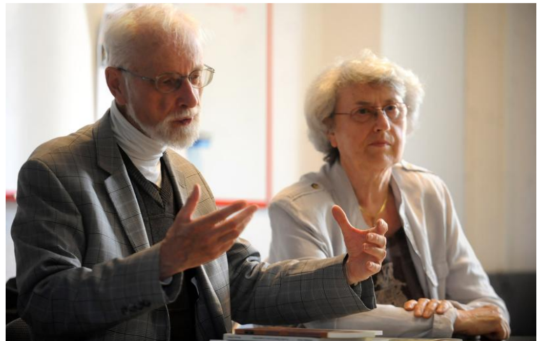
Le nouvel ouvrage de Dominique Braun, illustré par Michèle Robein, se lit à partir de 10 ans.

« Les autres livres jeunesse présentent souvent un laisser-aller