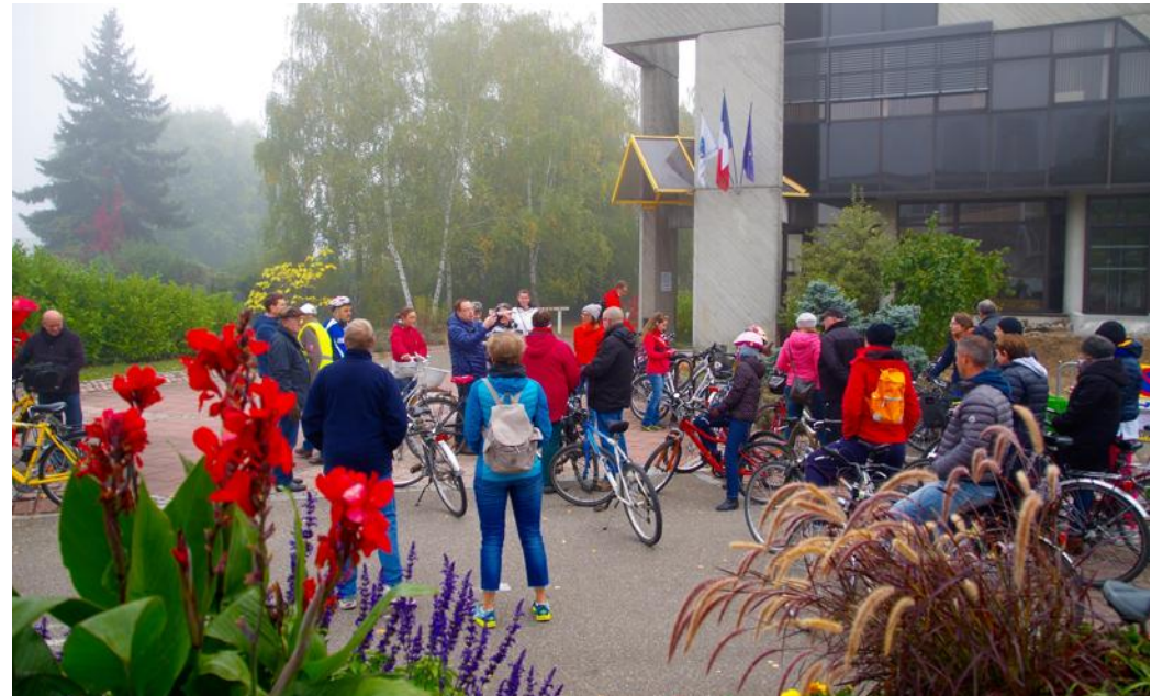
Une trentaine de personnes participaient à cette découverte de la ville à vélo.

L'objectif de cette matinée était de découvrir les nouveaux aménagements prévus, mais aussi redécouvrir certains coins oubliés, notamment lors du premier arrêt à l'étang Gériq. Toujours en exploitation, la carrière sera restituée à la ville en 2021, après réhabilitation des lieux par l'actuel exploitant : « Nous préparons le retour de la gravière dans le schéma de la ville, sachant que comme pour le Bohrie, nous voulons que ce lieu reste préservé et sécurisé, tout en offrant un cadre de vie et des aménagements collectifs. » Puis le maire a entraîné la troupe, à pied cette fois, pour lui montrer la biodiversité autour de l'étang. Juste avant que la longue colonne de vélos ne reprenne la route, l'adjointe à