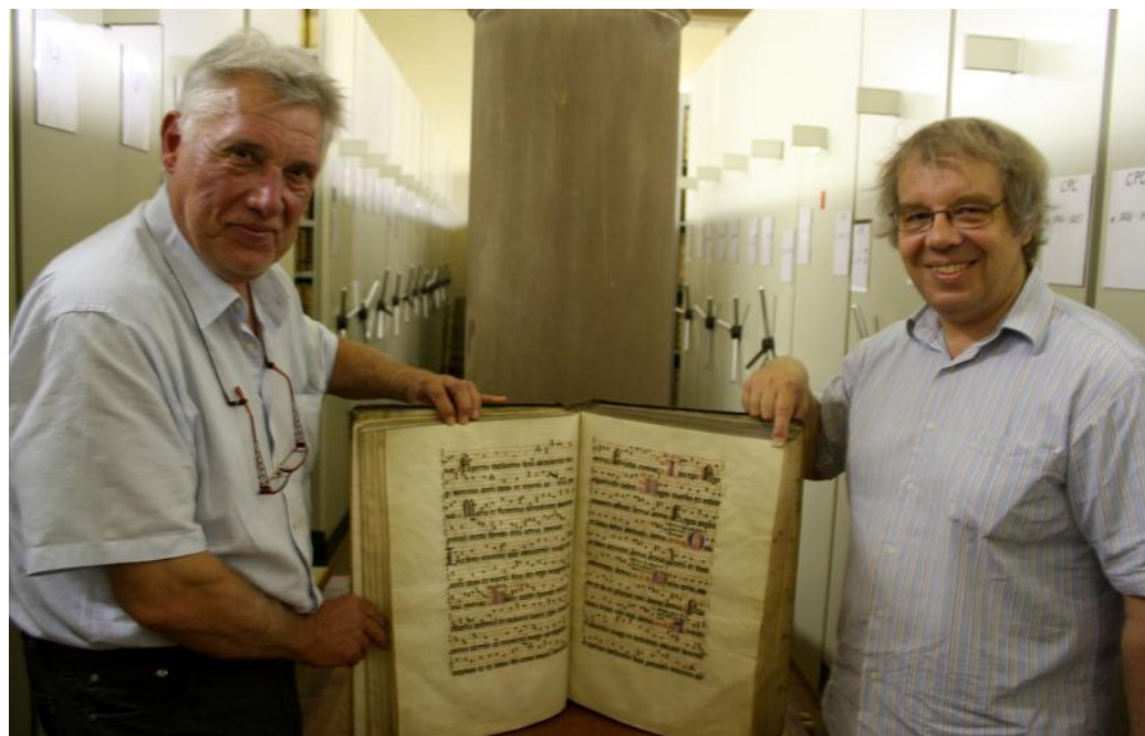
Un manuscrit du XIV e siècle, plus fiable qu'une tablette numérique